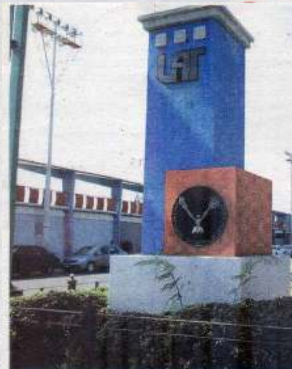
Universidad Autónoma de Tamaulipas apoya en tiempos de pandemia.

b) Para el caso de no tener ingresos propios, estar trabajando de forma independiente o estar desempleado, presentar carta escrita y firmada por el solicitante donde 'Bajo protesta de decir verdad' que declare su ingreso mensual o su situación económica.