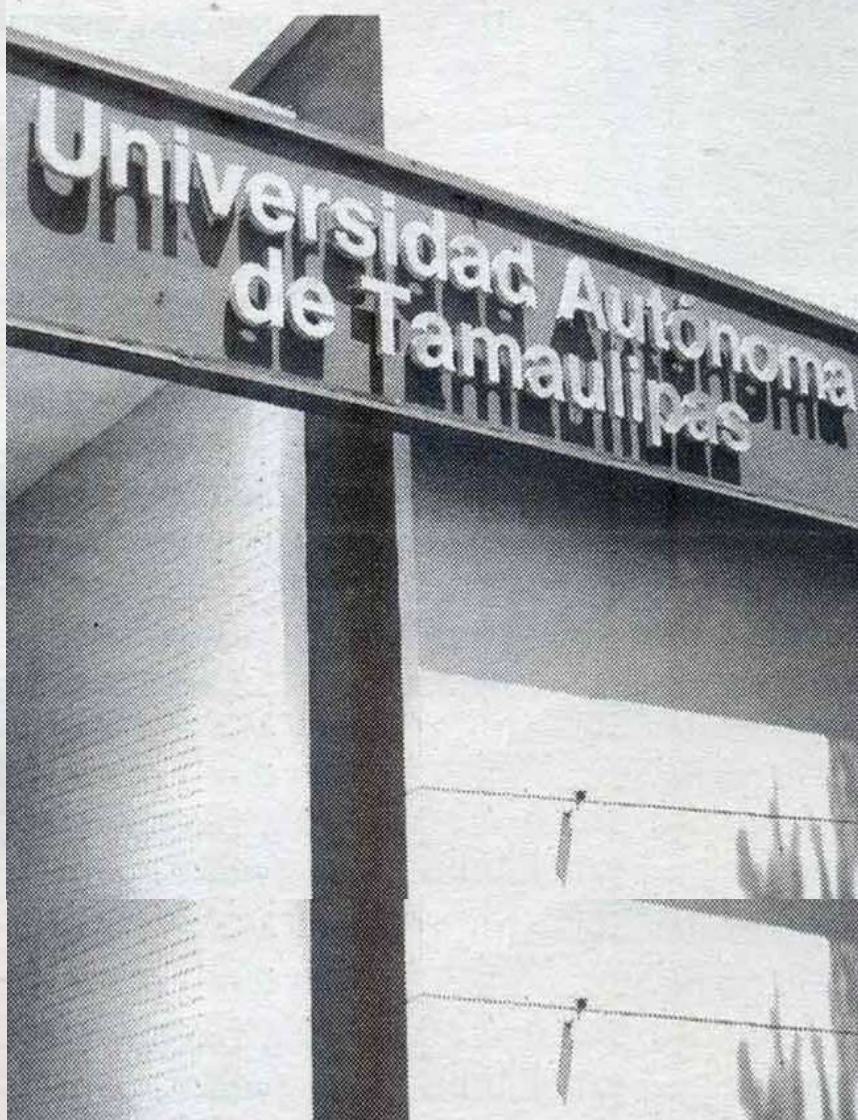
ALUMNOS DE la UAMM realizan prácticas en laboratorios de la misma institución

En cuanto a las actividades de trabajo social en empresas estatales y nacionales, éstas continúan suspendidas puesto que la indicación de la rectoría es no exponer al estudiante.