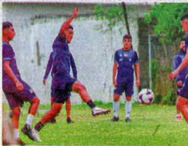
Jugadores del 'Corre' deberán reportar este lunes en el CeFor.