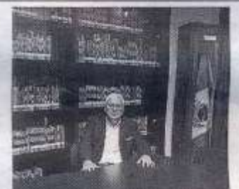
ENTREGA RECTOR nombramiento a titular de Investigaciones históricas de la UAT